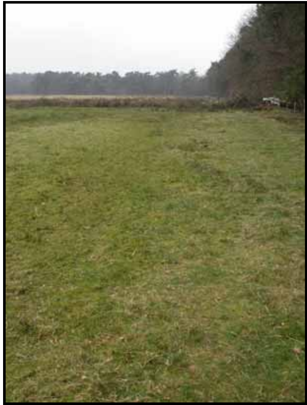
Sectie3: van paal 4 naar 3