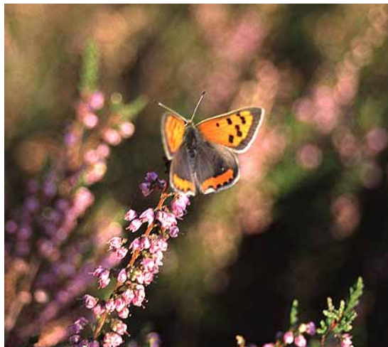
(Kleine vuurvliinder)