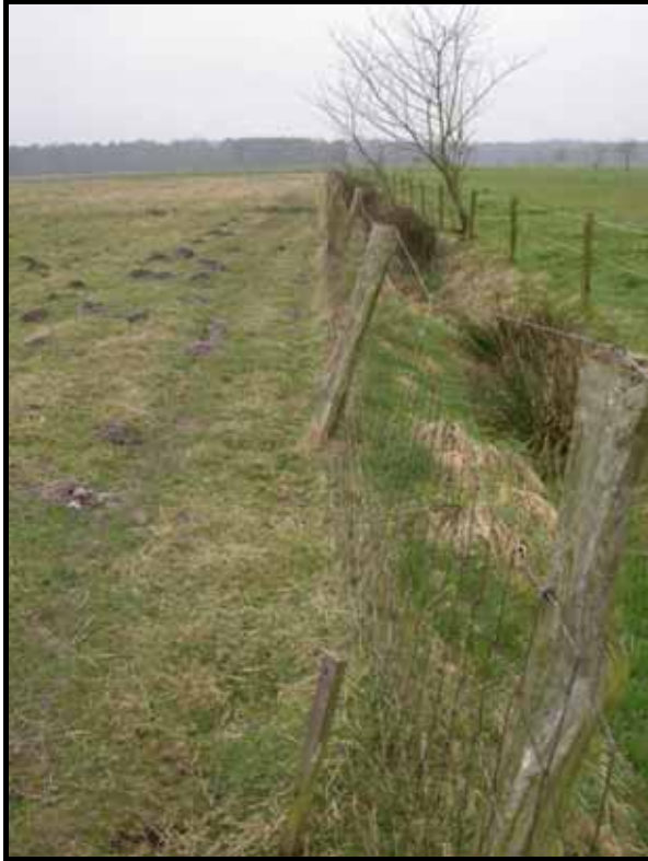
Sectie4: van paal 5 naar 6.