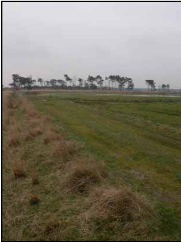
Sectie1: van paal 1 naar 2