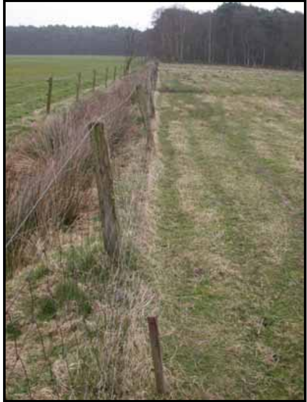
Sectie4: van paal 6 naar 5.