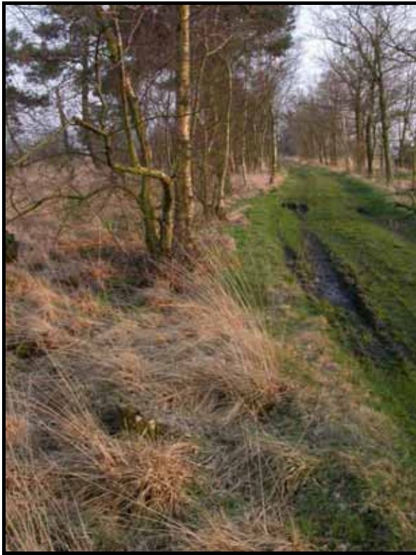
Sectie6: van paal 6 naar 7