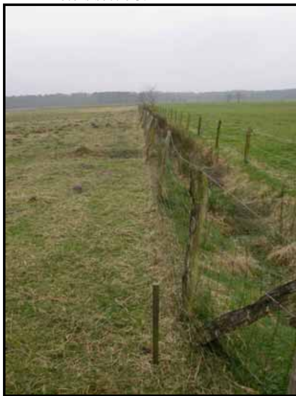
Sectie3: van paal 4 naar 5