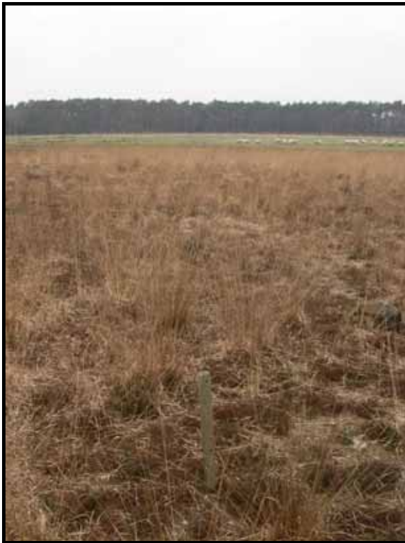
Sectie6: van paal 7 naar 8