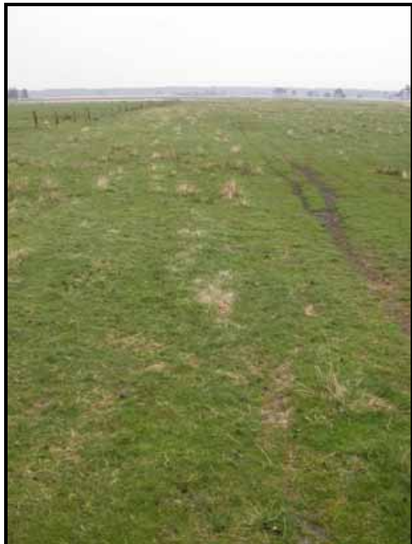
Sectie1-2-3-4: van paal 5 naar 1