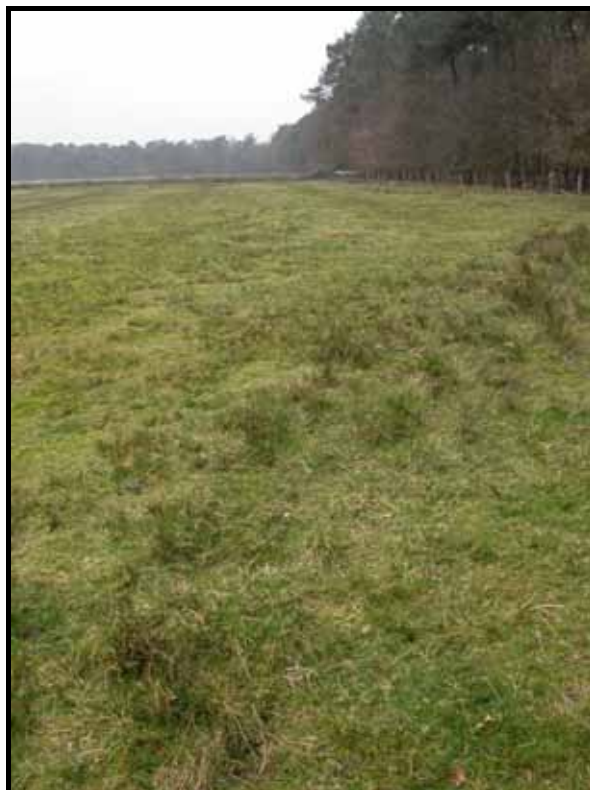
Sectie4-5: van paal 6 naar 4