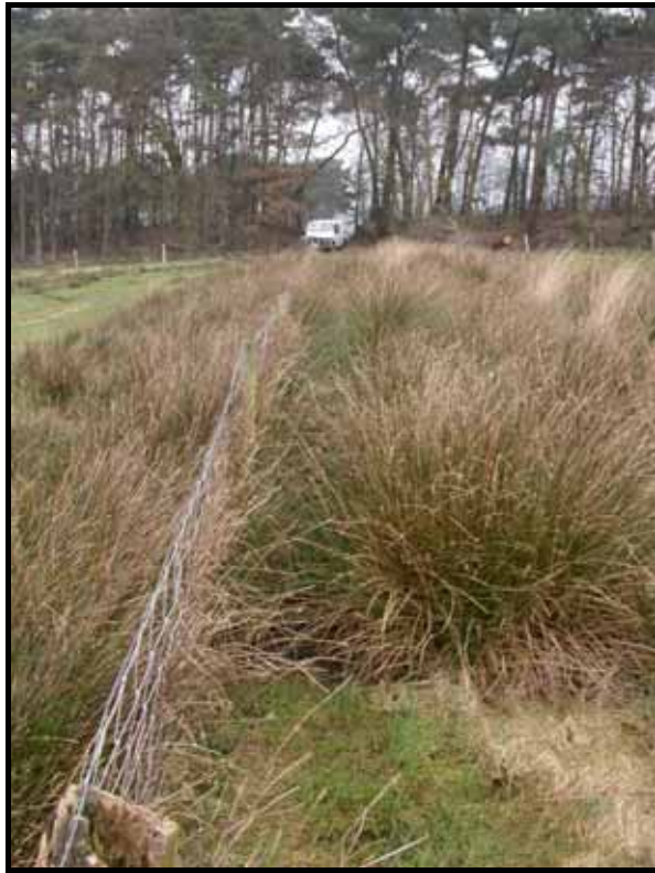
Sectie2: van paal 2 naar 3