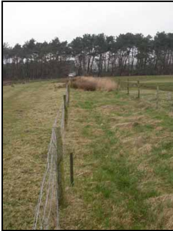
Sectie1: van paal 1 naar 2