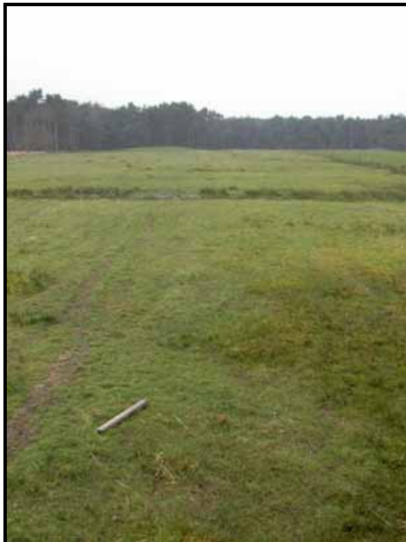
Sectie1-2-3-4: van paal 1 naar 5