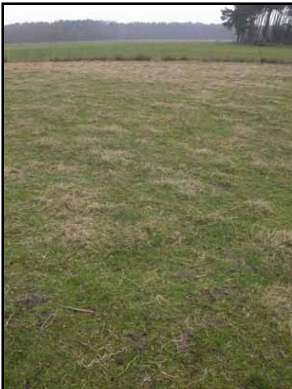
Sectie6: van paal 8 naar 6.