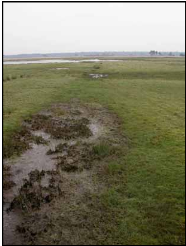
Sectie2-3-4-5-6 van paal 7 naar 2