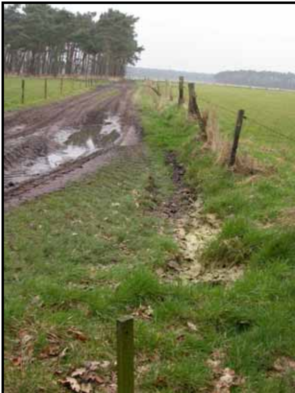
Sectie1: van paal 1 naar 2