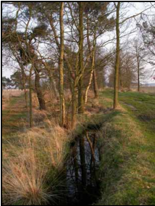
Sectie5: van paal 5 naar 6