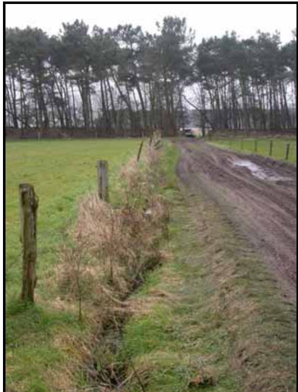
Sectie1: van paal 2 naar 1