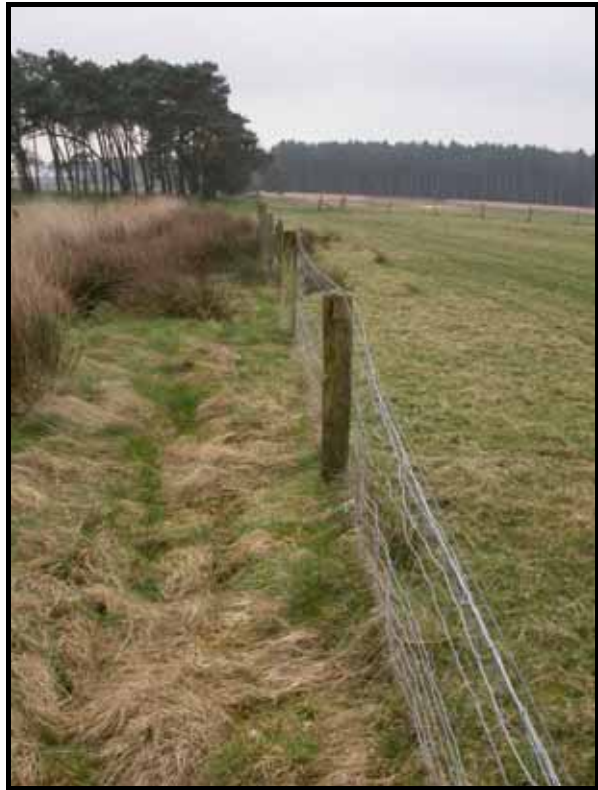
Sectie1: van paal 2 naar 1