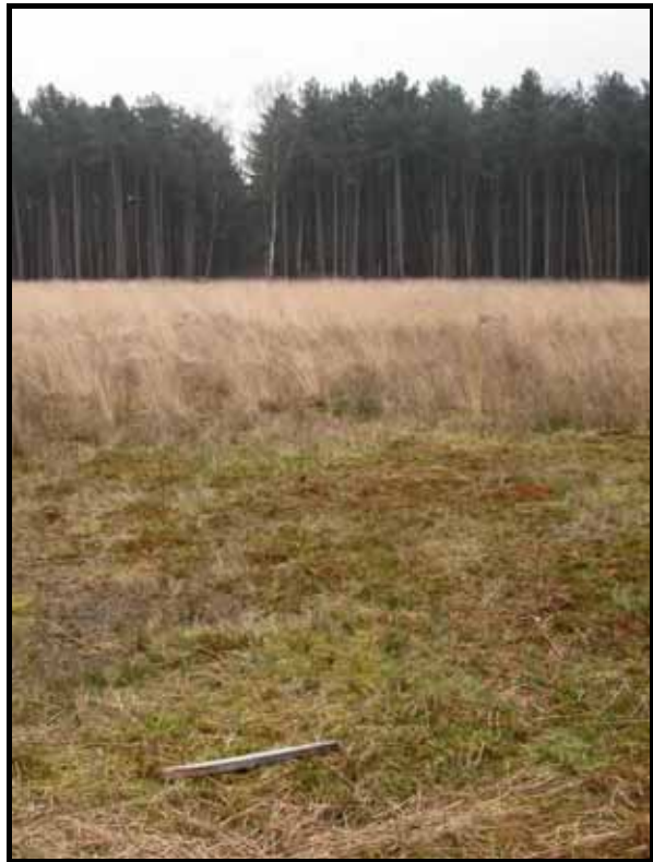
Sectie6: van paal 8 naar 7