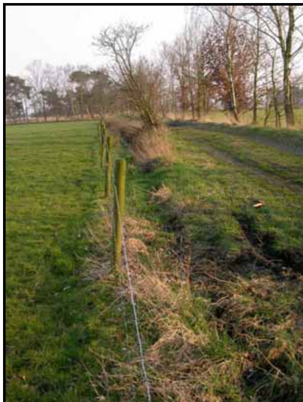
Sectie 3 en 4: van paal 3 naar 5