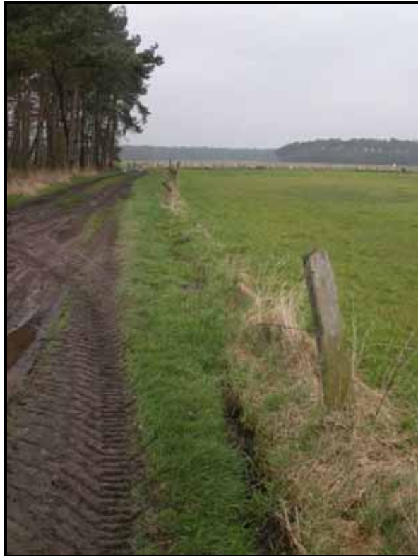
Sectie2: van paal 2 naar 3