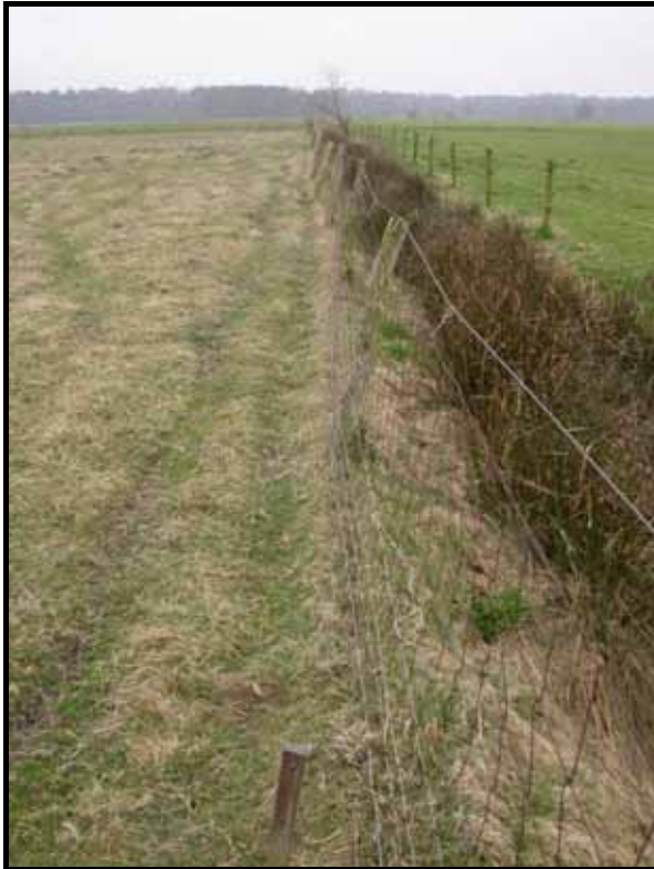
Sectie5: van paal 6 naar 7.