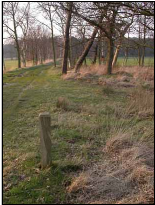
Sectie5: van paal 6 naar 5