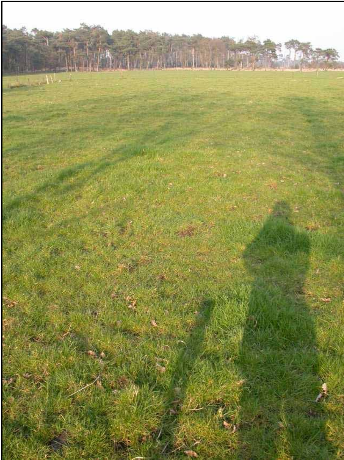
Sectie 1 en 2: van paal 1 naar 3