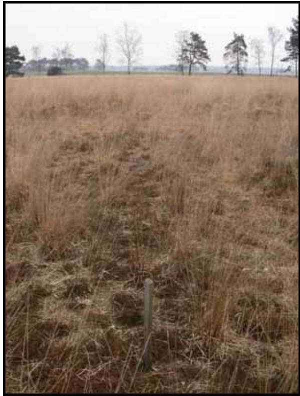
Sectie5: van paal 7 naar 6