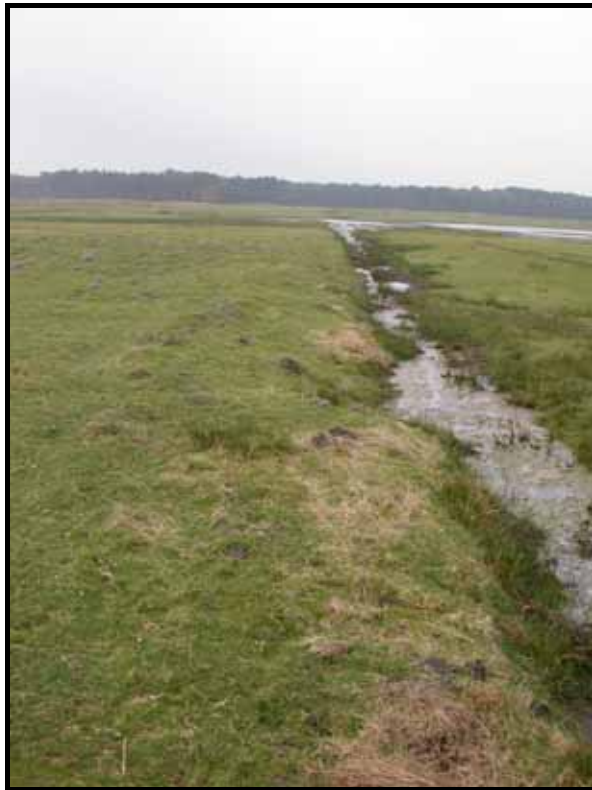
Sectie2-3-4-5-6: van paal 2 naar 7