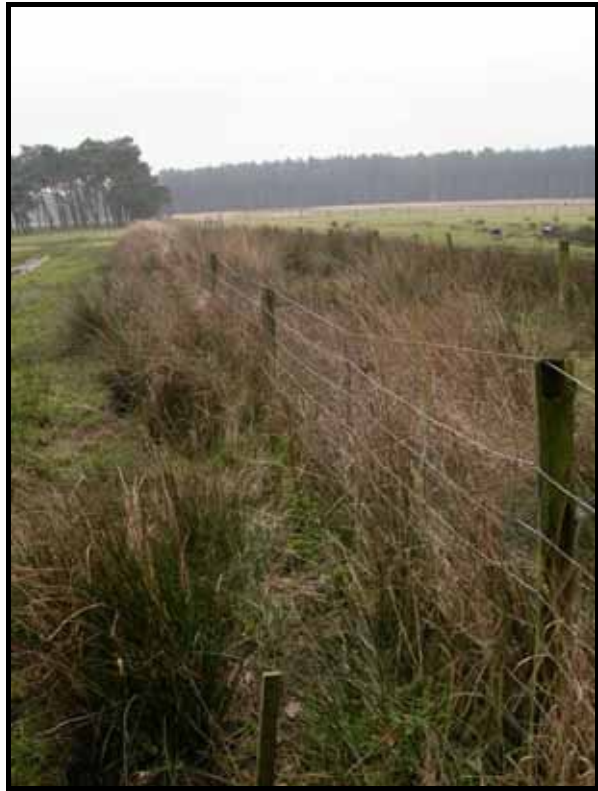
Sectie2: van paal 3 naar 2