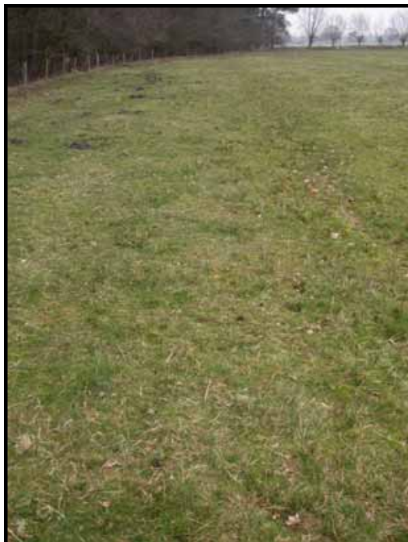
Sectie4-5: van paal 4 naar 6