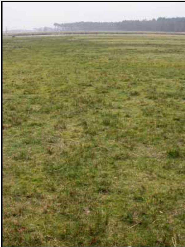
Sectie6: van paal 6 naar 7