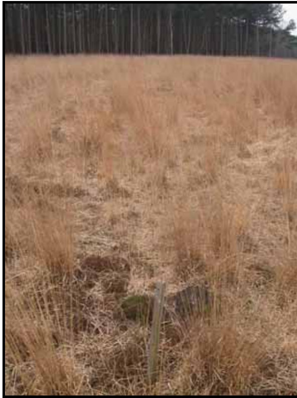
Sectie5: van paal 6 naar 7