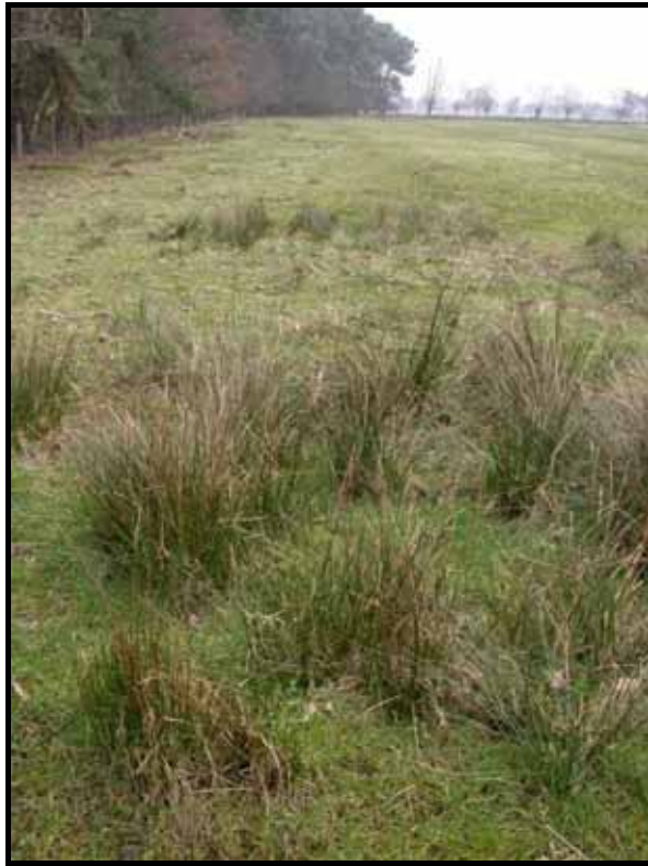
Sectie3: van paal 3 naar 4