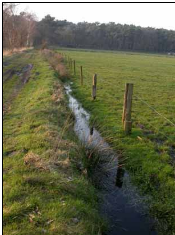
Sectie 4 en 3: van paal 5 naar 3