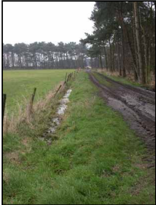
Sectie2: van paal 3 naar 2