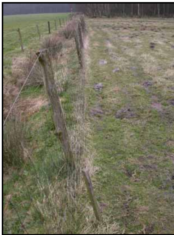
Sectie3: van paal 5 naar 4